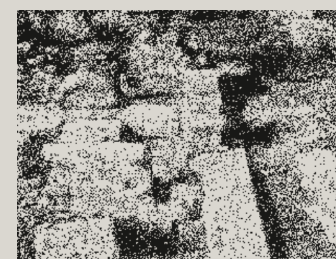
Βυζαντινό Οινοποιείο, Κόρινθος, Κεντρικός Αρχαιολογικός χώρος, R. L. Scranton, Corinth of Conducted by the American School of Classical Studies at Athens , τομ. XVI. Mediaeval Architecture in the Central Area of Corinth , Πρίνστον Ν.Υ. 1957 εικ. 11

Η Πελοπόννησος αποτελεί μία γεωγραφική ενότητα, που λόγω της πλεονεκτικής θέσης της επάνω στον εμπορικό θαλάσσιο δρόμο, που συνδέει την Κωνσταντινούπολη με την Δύση, συνιστά ιδανικό χώρο για την μελέτη της αγροτικής και βιοτεχνικής παραγωγής και διακίνησης προϊόντων κατά την βυζαντινή περίοδο (4ος-12ος αι.), που οριοθετείται μεταξύ του 4ου αι. (395), εποχή του χωρισμού του ανατολικού από το δυτικό ρωμαϊκό κράτος, και των αρχών του 13ου αι. (1204), οπότε με την εγκατάσταση των Φράγκων σημειώνεται μεταβολή των οικονομικών και των κοινωνικών συνθηκών στην περιοχή. Η συστηματική αρχαιολογική έρευνα κυρίως στις πόλεις της Κορίνθου, της Ήλιδας, της Μεσσήνης, στην Τεγέα-Νίκλι, στους αγροτικούς οικισμούς της Ολυμπίας, της ηλειακής Πύλου, της Νεμέας, οι σωστικές έρευνες στο Άργος, στην Σπάρτη, στην Πάτρα, καθώς και οι επιφανειακές έρευνες σε πλήθος αγροτικών οικισμών και αγροικιών συνέβαλαν στην αποκάλυψη πολυάριθμων στοιχείων δηλωτικών του οικονομικού βίου στον τομέα της πρωτογενούς παραγωγής και της μεταποίησης.