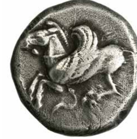
Κορίνθος (περ. 510 π.Χ.), Αργυρός στατήρας (8,47 γρ.) Νομισματική Συλλογή Alpha Bank, αρ. 2138