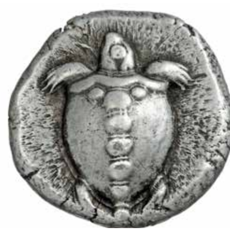
Αίγινα (480-456 π.Χ.), Αργυρός στατήρας (12,43 γρ.) Νομισματική Συλλογή Alpha Bank, αρ. 3939