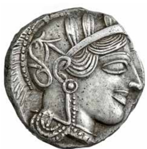
Αθήνα (479-454 π.Χ.), Αργυρό τετράδραχμο (17,17 γρ.) Νομισματική Συλλογή Alpha Bank, αρ. 2137

Τα νομίσματα της Αίγινας αποτελούν το κυριότερο ξένο νόμισμα σε περιοχές του κυρίως ελλαδικού χώρου όπου τα τοπικά νομισματοκοπεία δεν είχαν σημαντική παραγωγή. Τα νομίσματα της Κορίνθου διαχέονται, μέσω των αποικιών της, κυρίως στις αγορές της Δύσης και στη Μεγάλη Ελλάδα, ενώ τα νομίσματα των Αθηνών κυκλοφορούν ευρέως τόσο στη Δύση όσο και στην Ανατολή, όπου αποτελούν πηγή έμπνευσης για τη δημιουργία τοπικών απομιμήσεων.