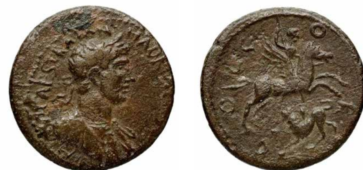
Κόρινθος (2ος αι. μ.Χ.)