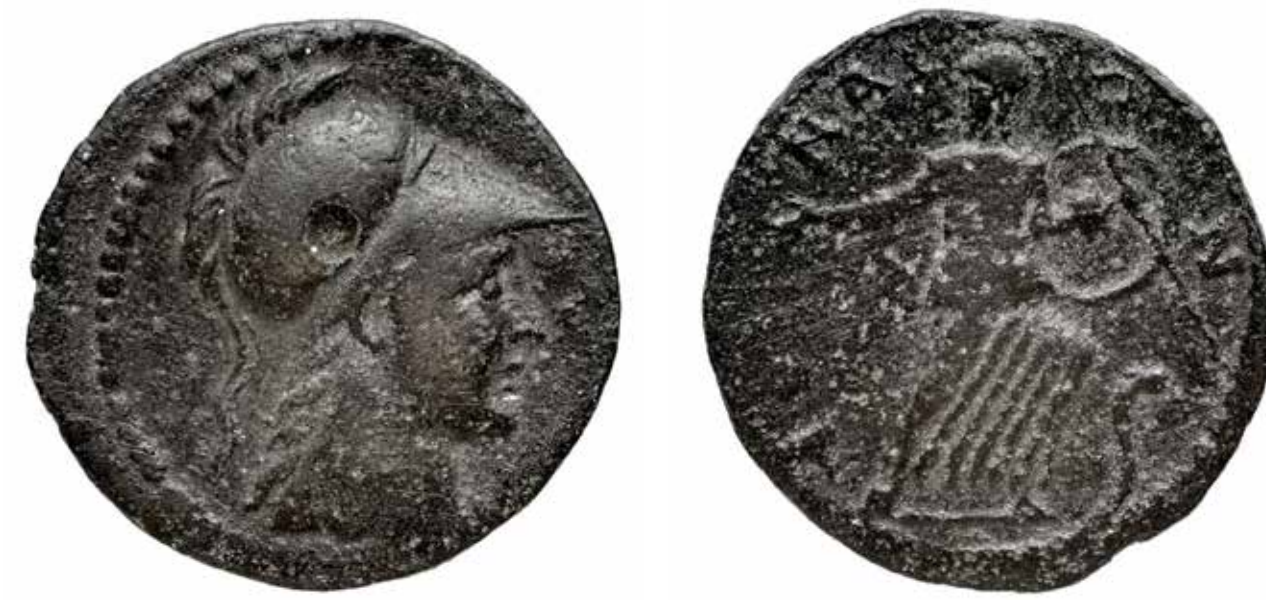
Αθήνα (α' μισό 3ου αι. μ.Χ.)