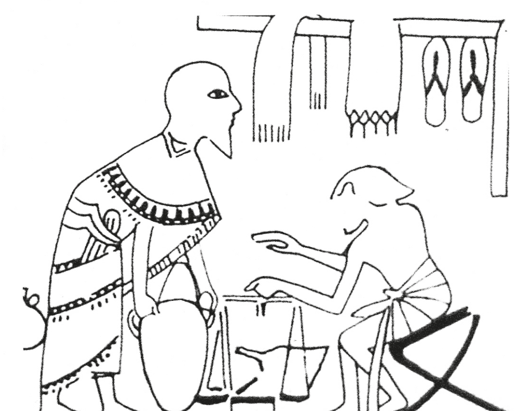
Εικονογράφηση εμπορικής συναλλαγής σε Αιγυπτιακό τάφο