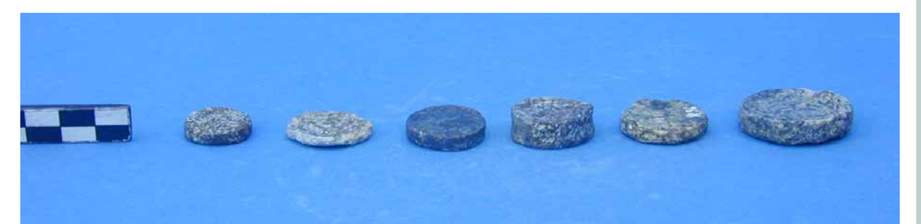
Μολύβδινα σταθμά του λεγόμενου «Μινωϊκού» μετρικού συστήματος