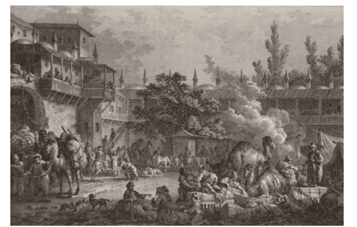
«Άποψη στην εσωτερική αυλή σε Χάνι ή Καραβάν σεράι, στη Μικρά Ασία» Από την έκδοση: M.G.F.A. comte de CHOISEUL-GOUFFIER, Voyage pittoresque de la Grèce. Παρίσι, J.-J. Blaise, [1809]

Τα δρομολόγια των δυτικοευρωπαίων περιηγητών προς την Ανατολική Μεσόγειο και τη Ν.Α. Ευρώπη (15ος-19ος αιώνας) είναι μια συνεχής ροή. Η διαδρομή που ακολουθεί ο ταξιδιώτης καθορίζεται από τις θεωρητικές του γνώσεις και τις ιδεολογικές του τοποθετήσεις, αλλά και από τους στόχους του και τις συγκυρίες στην εξέλιξη του ταξιδιού. Πάνω σε αυτά τά δίκτυα των δρομολογίων, το οποία παρουσιάζουν μια δυναμική εξέλιξη και πολύπλευρες διαφοροποιήσεις, καταγράφονται σταθμοί και λιμάνια, όπου και αναφέρονται καταλύματα ή άλλου τύπου χώροι διανυκτέρευσης. Στους σταθμούς του ταξιδιού παραδίδονται πληροφορίες για επαφές, ανταλλαγές και διασυνδέσεις με πρόσωπα. Τέλος, το δημοσιευμένο ταξιδιωτικό χρονικό προκαλεί, αλλά και τροφοδοτεί με κίνητρα, τους μελλοντικούς ταξιδιώτες. Αυτός ο κύκλος θεωρητικής γνώσης - προσωπικής εμπειρίας - συγγραφής αναμνήσεων δημιουργεί ένα συνεχές δίκτυο, ανταλλαγών εμπορευμάτων και διαλόγου ιδεών, θρησκευτικών αντιλήψεων και νοοτροπιών.