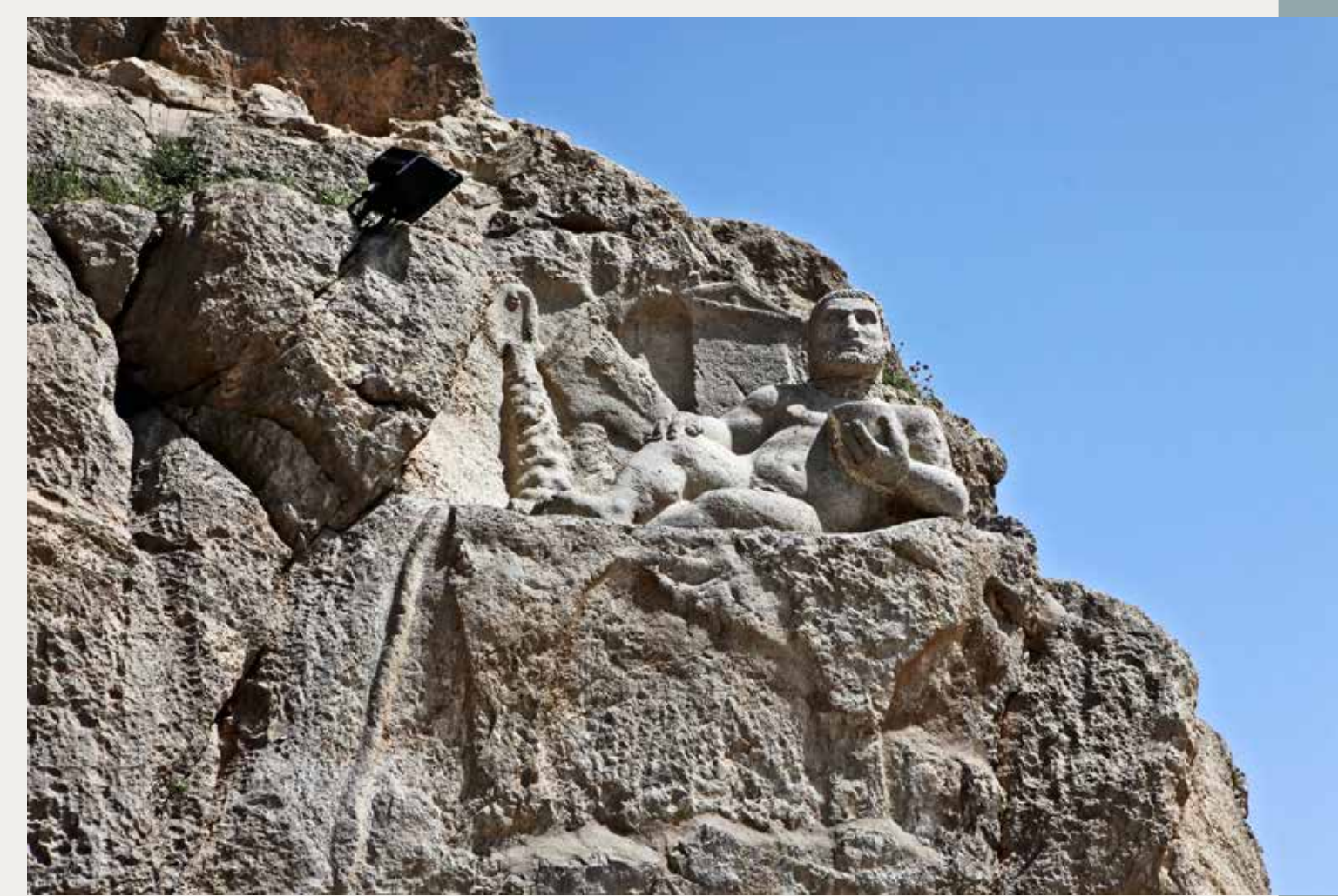
Αφιέρωμα στον Ηρακλή Καλλίνο για την ασφάλεια του διοικητή των 'Ανω Σατραπειών', Κλεομένη. 148 π.Χ. Όρος Μπισσοτούν, Κερμανσάχ, Ιράν. Ανασκαφές Α. Hakemi (Iranian Center for Archaeological Research, ICHTO), 1960. Υ. 1.90 μ.

Το υλικό που παρουσιάζεται συνδέεται με τρέχον έργο της υπεύθυνης ερευνήτριας για τις αρχαίες ελληνικές-ιρανικές σχέσεις στο Ιράν.